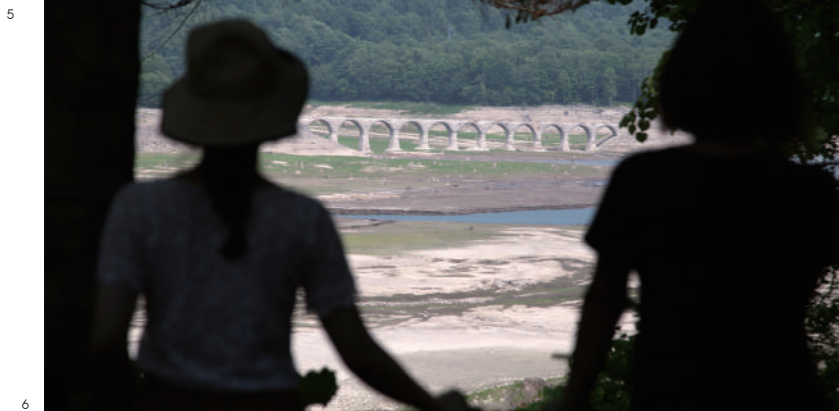
5_国道273号にある滝の沢橋からよく見える大きなアーチ橋は、第五音更川橋梁。 6_糠平湖の対岸からタウシュベツ橋梁を望む展望台からの眺め。