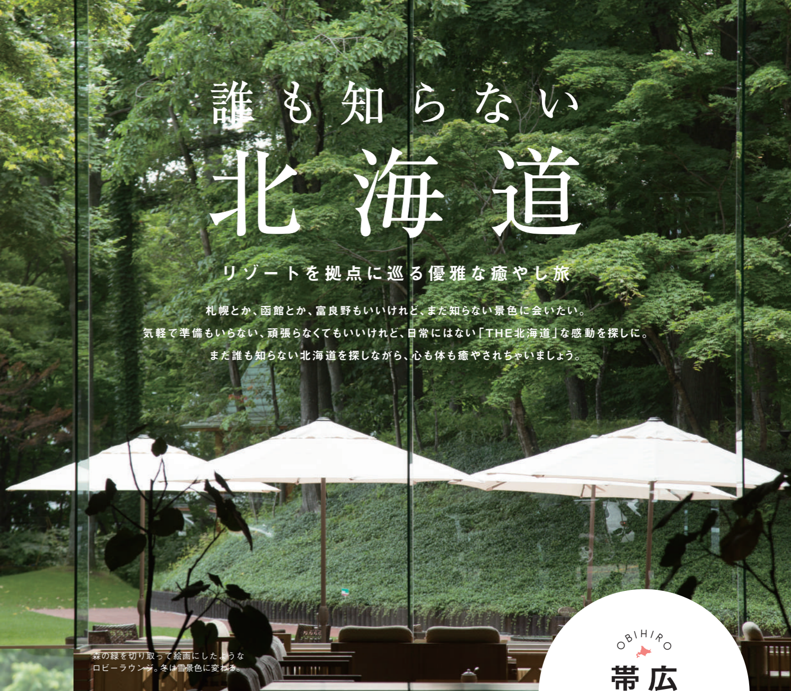
森の緑を切り取って絵画にしたようなロビーラウンジ。冬は雪景色に変わる。

札幌とか、函館とか、富良野もいいけれど、まだ知らない景色に会いたい。 気軽に準備もいらない、頑張らなくてもいいけれど、日常にはない「THE北海道」な感動を探しに。 まだ誰も知らない北海道を探しながら、心も体も癒やされちゃいましょう。