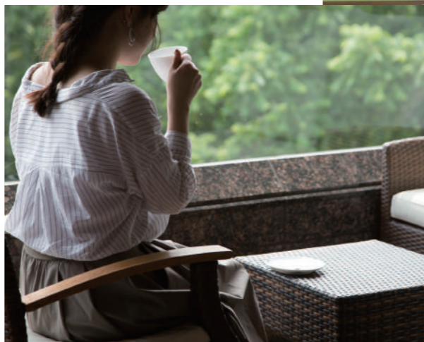
客室に用意されたコーヒーで、ほっと一息。